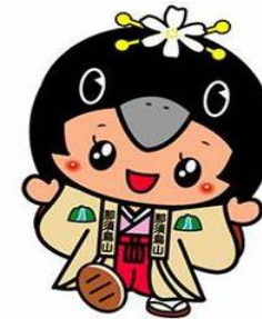
那須烏山市キャラクター