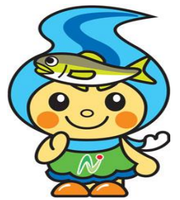
那珂川町キャラクター