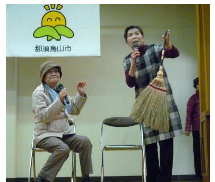
寸劇「軽度認知症って知ってっけ」熱演中