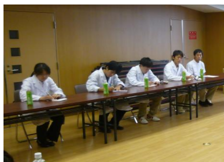
医学生と運営委員との懇談会

地域医療を守り、支えて行きたいという若者の情熱と夢が熱を帯びて語られ、研修するうちに、進行する高齢化社