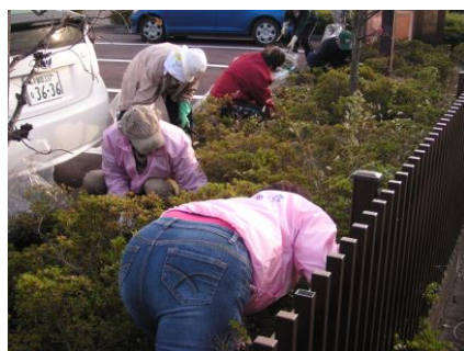
2回実施した那須南病院周辺清掃活動

毎年恒例となった活動のせいか皆さん手際よく作業を進めることが出来ました。皆様ご協力有難うございました。