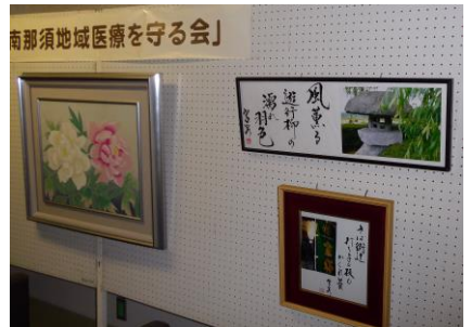
いろいろな団体、個人の協力で1ヶ月毎に展示を変更しています

病院内作品展示は、いろいろな同好会や団体に協力を頂き、月替わりで模様変えをしています。